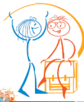
FAMILIENBEGLEITHEFT 3 WEGWEISER FÜR ELTERN UND FAMILIEN MIT KINDERN UNTER 18 JAHREN VON 7 BIS 18 JAHREN

Auch in diesem Jahr werden die Fallwerkstätten stattfinden, um sich anhand konkreter Fälle zum Thema Kindeswohlgefährdung auszutauschen und aus der praktischen Fallarbeit mit- und voneinander zu lernen.