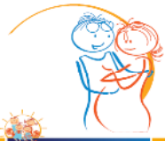
FAMILIENBEGLEITHEFT 1 WEGWEISER FÜR WERDENDE ELTERN