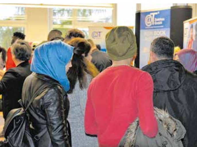
Über 600 Besucher kamen am 9. November 2019 zur ersten Integrationsmesse in das Berufliche Schulzentrum „August Horch“ in Zwickau.

Der Landkreis Zwickau wird dabei aus Mitteln des Europäischen Sozialfonds gefördert.