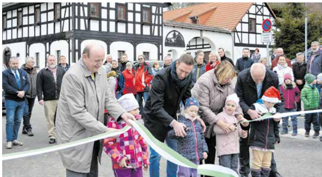
Die „Kleinen Strolche“ übernehmen den symbolischen Schnitt.

Die Baumaßnahme 2.1 und 2.3 der Schönberger Hauptstraße sind vor- bzw. nachgelagerte Abschnitte der zwischen 2016 und 2017 vom gleichen Bauunternehmen realisierten Hochwasserschadensbeseitigung auf einer