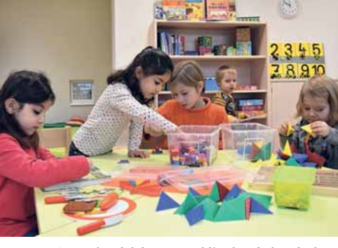
Am 27. Februar lädt die Kita am Rudolf Virchow Klinikum Glauchau zu einem Tag der offenen Tür ein.