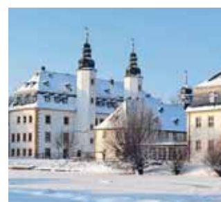
Schloss Blankenhain

Seit dem 10. Februar 2016 lädt die Sonderausstellung „Design des DDR-Alltags“ alle Interessenten ins Deutsche Landwirtschaftsmuseum ein.