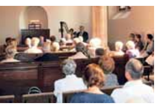
Schönburger Meisterkonzert des Sächsischen Orgelakademie e.V. im Juni 2015 in der Schlosskapelle Waldenburg

Das nächste Konzert mit dem Motto „Nordische Orgelromantik“ findet am Sonntag, dem 21. Februar 2016 um 17:00 Uhr in der Schlosskapelle, des Schlosses Waldenburg, Peniger Straße 10, statt. Eintrittskarten zu 10 EUR, ermäßigt 8 EUR sind an der Abendkasse bzw. in der Buchhandlung Steffi Grigo in Waldenburg erhältlich. Am Sonntag, dem 20. März 2016 werden um 17:00 Uhr Nachwuchstalente der Kreismusikschule des Landkreises Zwickau „Clara Wieck“ ein abwechslungsreiches Programm mit verschiedenen Instrumenten gestalten. Eintrittskarten zu einheitlich 5 EUR sind an der Abendkasse oder in der Buchhandlung Steffi Grigo, erhältlich, für Vorschulkinder ist der Eintritt frei.