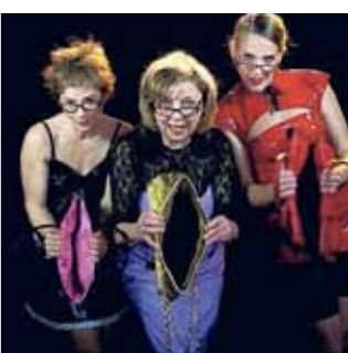
„Die singenden Handtaschen“

„Die singenden Handtaschen“ kommen in den Landkreis