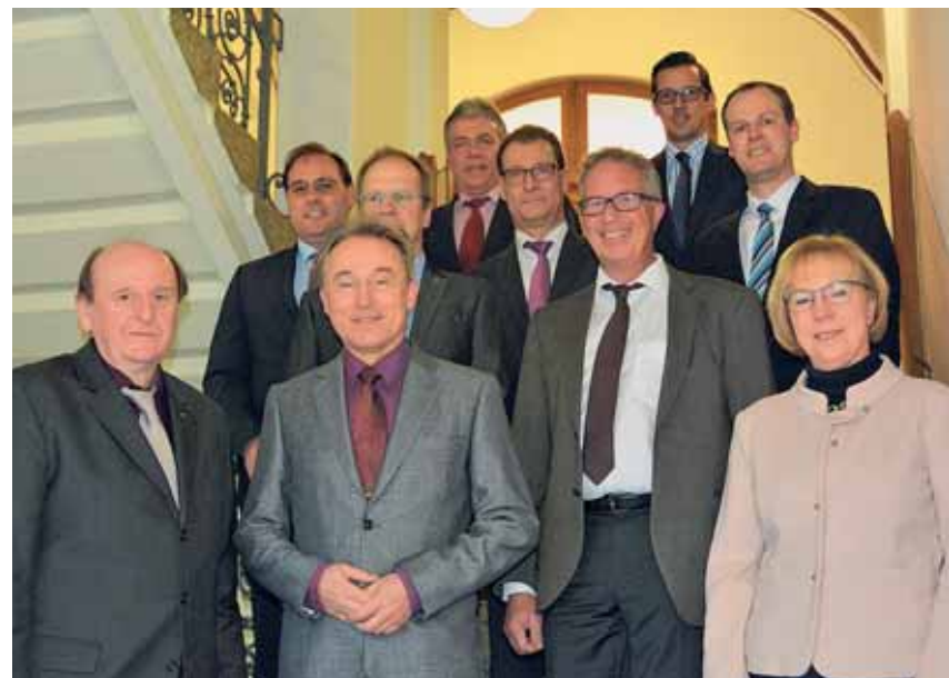
Gemeinsames Treffen der Delegation aus dem Landkreis Ludwigsburg mit ihren Zwickauer Amtskollegen.