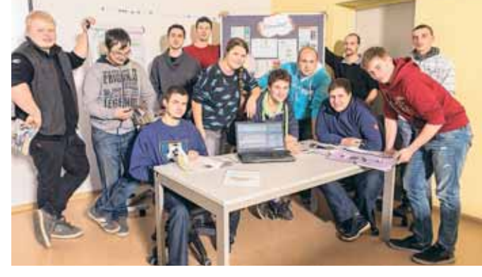
Diese Fachschüler werden am 12. März 2016 Schülern ab Klasse 7 die Grünen Berufe schmackhaft machen.

Weitere Informationen unter: www.deine-gruene-zukunft.de