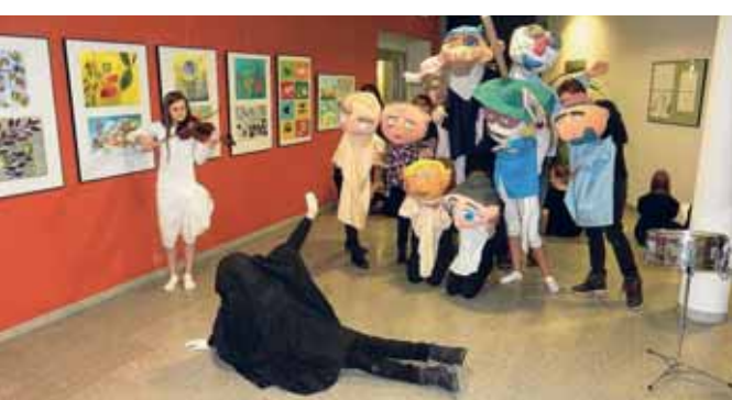
Zur Ausstellungseröffnung zeigten die Schüler des Alexander von Humboldt-Gymnasiums Werdau ein kleines Programm.

dienstags von 09:00 bis 12:00 Uhr und 13:00 bis 18:00 Uhr sowie donnerstags von 09:00 bis 12:00 Uhr und 13:00 bis 15:00 Uhr