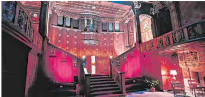
Treppenhalle im Schloss Waldenburg bei Nacht