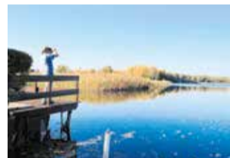
„Auf Vogelsuche im Teichgebiet“

Vogelstimmenwanderung durch das Landschaftsschutz- und Natura 2000-Gebiet der Limbacher Teiche