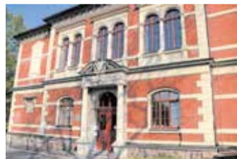
BSZ Glauchau, Haus 2

Im Haus 2, Am Schillerplatz 1, werden die Bildungsgänge Berufsvorbereitungsjahr, Berufsvorbereitende Bildungsmaßnahme sowie die Fachpraktikerausbildungen vorgestellt.