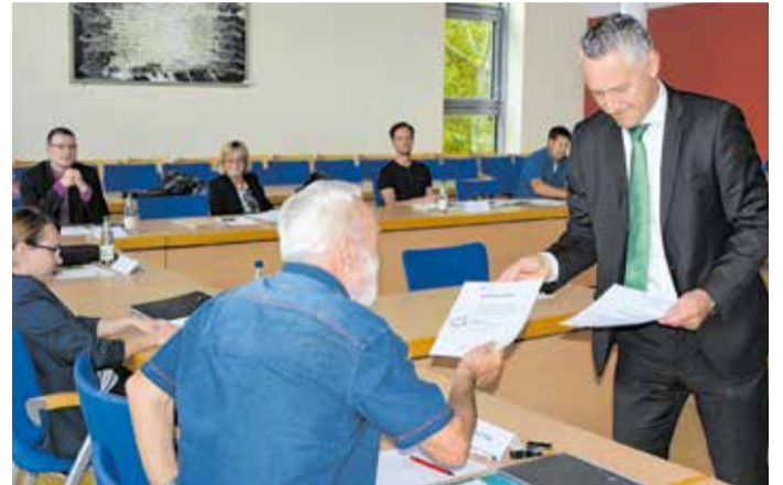
Berufung des Klimabeirates

Die Notwendigkeit hierfür, speziell für die kreiseigenen Liegenschaften, ist in den aktuellen Zeiten der Energiekrise notwendiger denn je. Auch in den nächsten Jahren werden die Energiekosten weiter steigen und der Einsatz erneuerbarer Energien immer wichtiger.