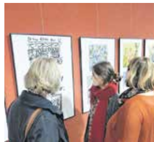
Die Ausstellung „Stückwerk(e)“ zeigt noch bis zum 1. April Arbeiten von Werdauer Gymnasiasten.

Noch bis zum 1. April 2016 kann im Verwaltungszentrum des Landratsamtes in Werdau, Königswalder Straße 18, die Ausstellung „Stückwerk(e)“ – Schülerarbeiten des Gymnasiums „Alexander von Humboldt“ Werdau – besichtigt werden.