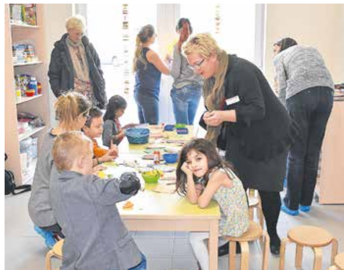
Bastelaktion zum Tag der offenen Kindergartentür

Neben all diesen Dingen wurde am Samstag auch der Name der neuen Einrichtung bekannt gegeben. „Firlefanz und Wirbelwind“ Kindertagesstätte am Klinikum Glauchau – ist die offizielle Bezeichnung. Neben allen wichtigen, pädagogischen Ansätzen darf auch das „Kind sein“ nicht zu kurz kommen. So dürfen Kinder eben mal Quatsch und Firlefanz machen und wie ein Wirbelwind mit den Rollern durch die Flure sausen.