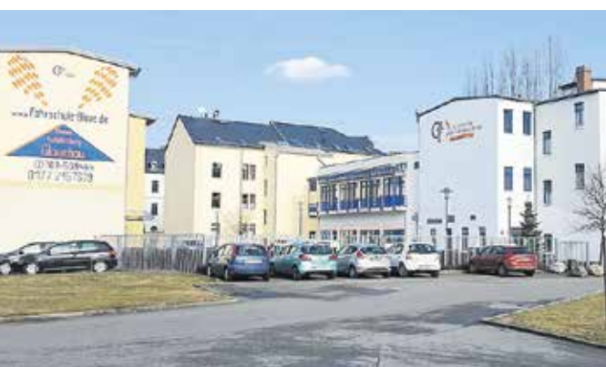
Der Hauptsitz des Vereins in der Bahnhofstraße 1 bis 3 in Glauchau hat sich zu einem richtigen Komplex entwickelt.

Unterstützung von Kindern, Jugendlichen und Erwachsenen bei ihrer persönlichen Entwicklung, ihrer beruflichen Perspektive und bei der Bewältigung sozialer Probleme verändert. So reicht heute das Leistungsspektrum von Maßnahmen der Agentur für Arbeit und dem Jobcenter – wie zum Beispiel berufsvorbereitende Bildungsmaßnahmen, außerbetriebliche Berufsausbildung, ausbildungsbegleitende Hilfen, verschiedene Maßnahmen für Langzeitarbeitslose – über Maßnahmen der Berufsorientierung und des Kinder- und Jugendhilfegesetzes, Verbundausbildung, dem Betreiben einer Kompetenzagentur