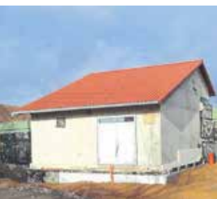
Hochbehälter in Werdau

Besichtigung des Hochbehälters in Werdau möglich