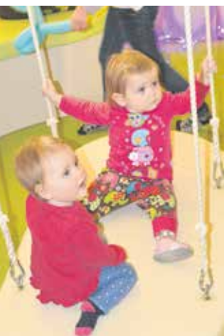
Am Samstag, dem 27. Februar 2016, Schaukeln im Snoezelraum der Kindertagesstätte „Firlefanz und Wirbelwind“

Kita trägt den Namen „Firlefanz und Wirbelwind“