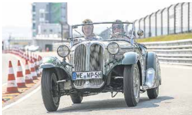
Die 14. Sachsen Classic Rallye macht in diesem Jahr Station beim Verkehrssicherheitstag.

18. Sächsischer Verkehrssicherheitstag auf dem Sachsenring