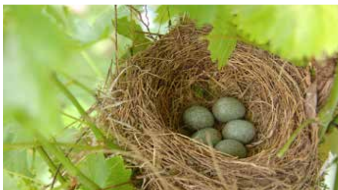
Amselnest mit Gelege in Weinrebe

Beim Pflegeschnitt auf Nistplätze achten