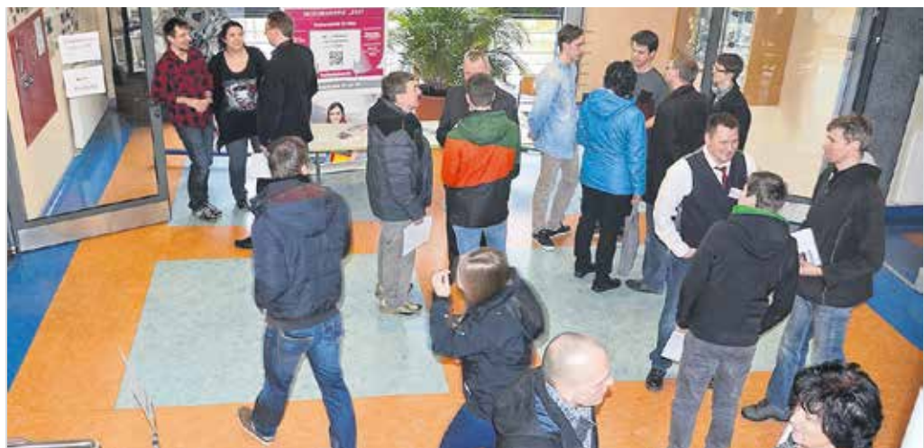
Großes Interesse zeigten die Besucher zum Tag der offenen Tür am BSZ für Technik „August Horch“ in Zwickau.

Besucher informierten sich über Ausbildungsperspektiven