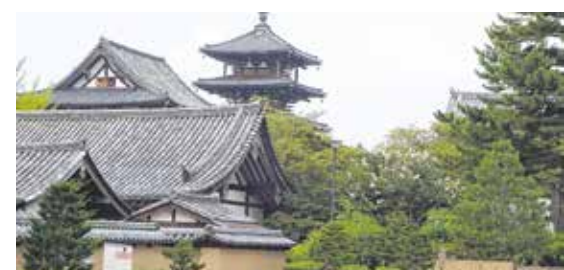
Buddhistischer Tempel in Japan

Einführung in die japanische Sprache und Kultur, Teil 3