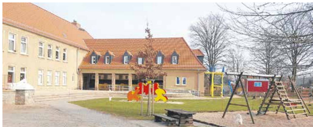
Über das Programm Kita-Invest konnten in der Kindertagesstätte Märchenland sowohl Innen- als auch Außenbereiche für die Jüngsten erneuert und verschönert werden.