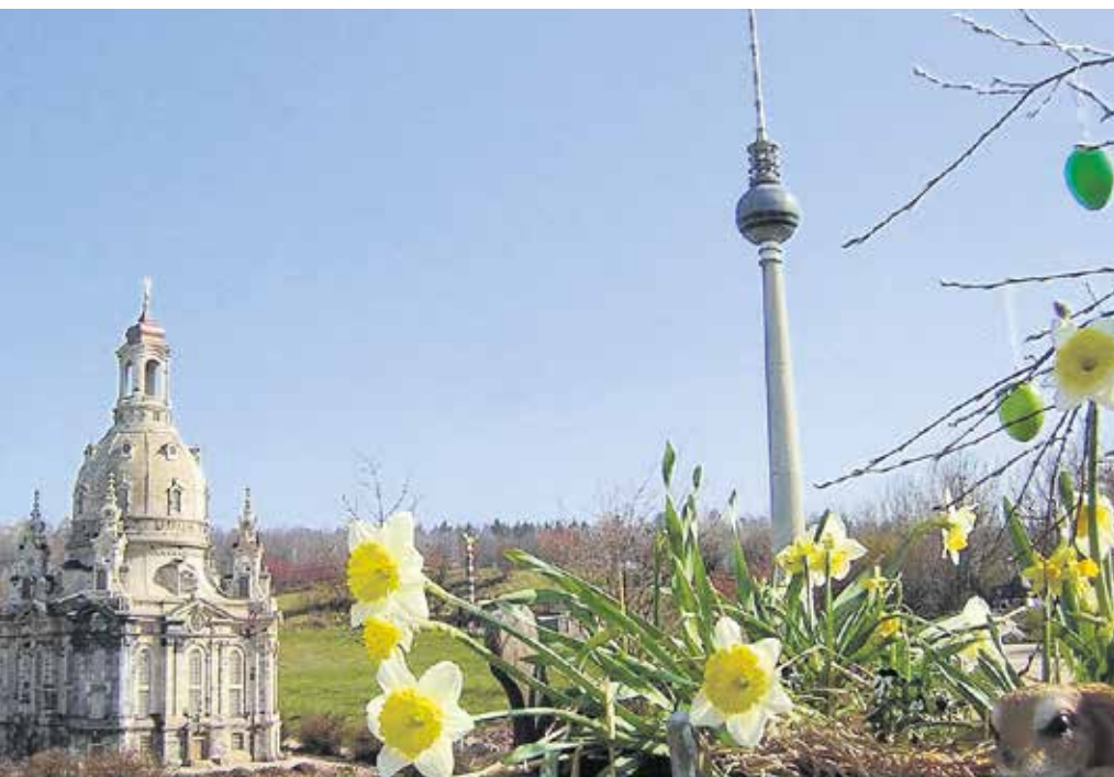
Ostern in der Miniwelt