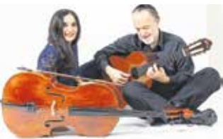
Duo Burstein & Legnani

Duo Burstein & Legnani spielen Klassik und Weltmusik