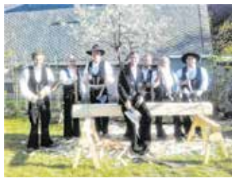
Haspelbau durch Zimmerleute aus der Lausitz

Interessierte können auch den gut ausgeschilderten Natur- und Bergbaulehrpfad, einen Rundwanderweg, mit zahlreichen Schautafeln und Relikten des mittelalterlichen Bergbaus ab dem 13. Jahrhundert erkunden.