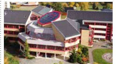
Blick auf das Gymnasium in Kirchberg

Informationse Elternabend für die Grundschulklasse 3