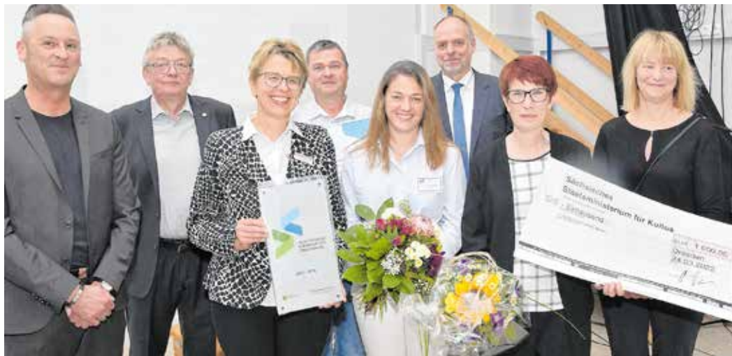
Glücklicher Preisträger: Die Oberschule Leubnitz gehört zu derzeit 50 „Siegelschulen“ in Sachsen, die das Zertifikat tragen.

Die Oberschule Leubnitz in Werdau hatte am 6. Mai 2022 gleich doppelten Grund zur Freude: Zum einen konnte die Berufsorientierungsmesse „Ein Blick in die Zukunft“ erstmals seit der Corona-Zwangspause wieder in Präsenz stattfinden. Zum anderen wurde sie erneut mit dem „Sächsischen Qualitätssiegel für Berufliche Orientierung“ ausgezeichnet.