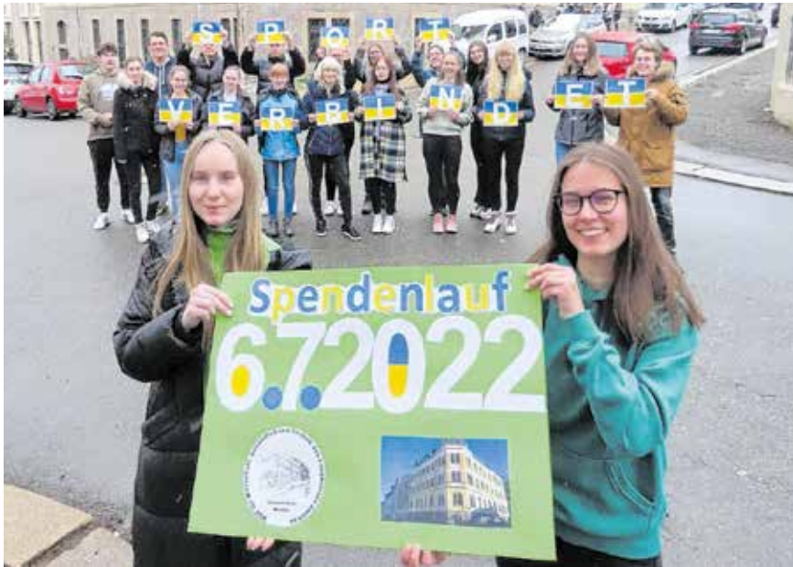
Schülerinnen und Schüler des BSZ Werdau organisieren einen Spendenlauf für die Ukrainehilfe.