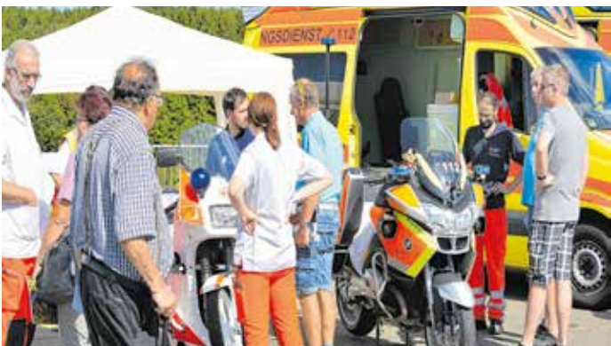
Impressionen Verkehrssicherheitstag 2019