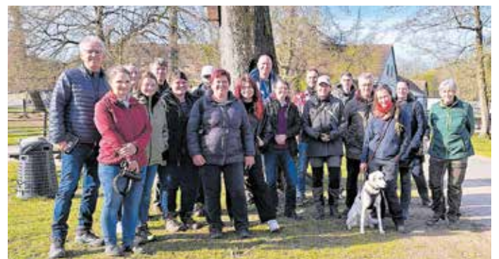
Naturliebhaber trafen sich zum Frühlingsspaziergang im Tierpark.

Wie erwartet, waren wieder mehrere Vogelarten singend bzw. rufend zu hören. So weckten u. a. Wacholderdrossel, Sommergoldhähnchen, Zaunkönig, Gartenbaumläufer Rotkehlchen, Buchfink und Stieglitz die Aufmerksamkeit der Besucher. Zudem gab es Antworten auf Fragen zum Vogelschutz, zum Vorkommen von Weißstorch, Graureiher und zu an Gebäuden nistenden Vogelarten im Landkreis sowie zur