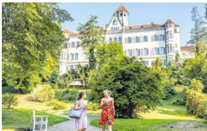
Schloss Waldenburg

3. und 10. Juni 2023 jeweils 11:30 Uhr und 14:30 Uhr