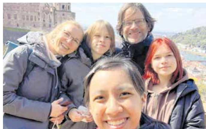
Gastfamilie beim Ausflug

Ab September 2023 haben Familien in der Region Zwickau wieder die Möglichkeit, ein internationales Gastkind für ein halbes oder ganzes Schuljahr bei sich zu Hause aufzunehmen. Rund 220 Jugendliche zwischen 15 und 18 Jahren reisen mit der gemeinnützigen Jugendaustauschorganisation AFS Interkulturelle Begegnungen e. V. nach Deutschland, um hier in einer Gastfamilie die Kultur und Sprache des Landes kennenzulernen und sich persönlich weiterzuentwickeln. Viele Gastfamilien entwickeln lebenslange Freundschaften zu ihren Gastkindern.