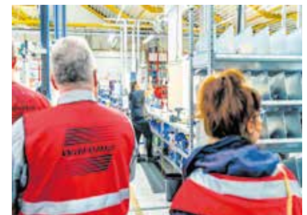
Warema Sonnenschutztechnik GmbH Foto: Oliver Göhler

Seit Februar 2023 arbeiten Chemnitz, Zwickau sowie das Rochlitzer Muldental in Mittelsachsen in der touristischen Vermarktung als sogenannte Destination CHEMNITZ. ZWICKAU. REGION. zusammen, um Synergien zu stärken. Gleichzei-