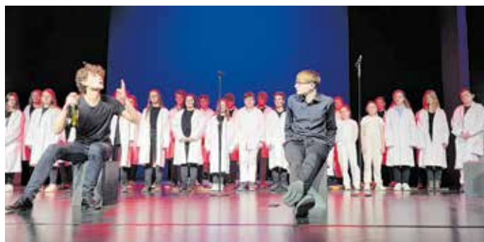
Musical „Schach 2.0“

Neben den wöchentlichen Proben brachte auch die Teilnahme am diesjährigen Schultheaterfestival im März wertvolle Impulse für die Kinder und Jugendlichen, die in der Schauspielgruppe, dem Chor, der Band, dem Orchester, der Technikgruppe oder der Gruppe, die sich um Bühnenbild, Maske, Kostüme und Werbung