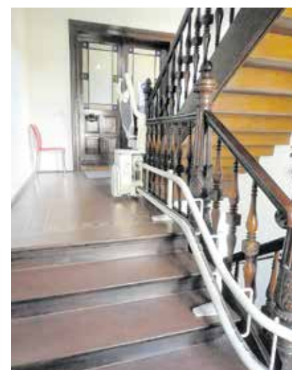
Einbau eines Treppenliftes zur Zahnarztpraxis