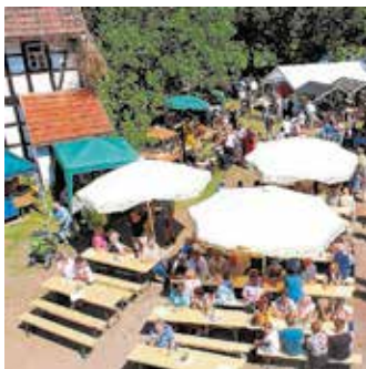
Gräfenmühle Neukirchen