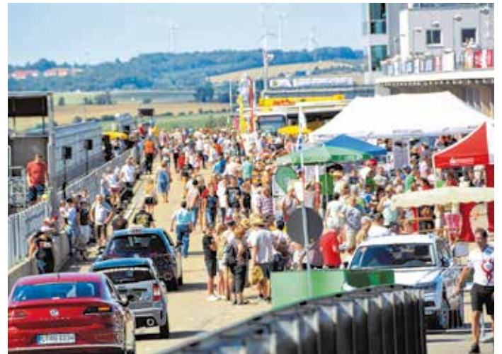
Verkehrssicherheitstag 2019

An der Bühne treffen Rennsport und Verkehrssicherheit aufeinander. Rallye-Profi Julius Tannert und die Motorradsportfamilie