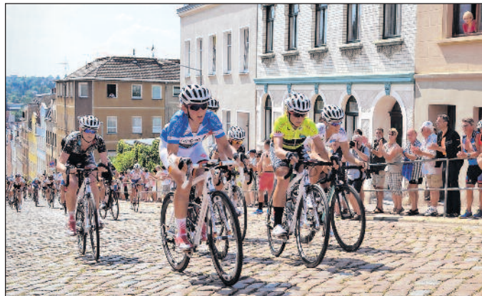
Bergwertung an der Steilen Wand in Meerane zur Thüringen-Rundfahrt der Frauen 2014. Am 19. Juli 2015 ist die Steile Wand Start- und Zielort der vierten Etappe „Rund um Meerane“.

Zwei Monate vor den 82. UCI-Straßenrad-Weltmeisterschaften in Richmond/USA trifft sich die Weltelite des Frauenradsports bei der 28. Internationalen Thüringen-Rundfahrt der Frauen vom 17. bis 23. Juli 2015 zu einer wichtigen Generalprobe auf Thüringens Straßen. Und nicht nur dort: Die Weltelite des Frauenradsports kommt auch wieder nach Sachsen – nach Meerane! Die „Steile Wand“, die es für die Fahrerinnen in den vergangenen Jahren bereits mehrfach zu bezwingen galt, erhält in diesem Jahr eine besondere Wertschätzung – am Sonntag, dem 19. Juli 2015, wird sie Start- und Zielort der ca. 79 Kilometer langen vierten Etappe „Rund um Meerane“ sein. Die Fahrerinnen absolvieren vier Runden mit insgesamt drei Bergwertungen an der Steilen Wand und drei Sprintwertungen auf der Seiferitzer Allee im Gewerbegebiet.