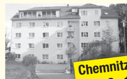
Chemnitzer Straße 1a

26 WE mit 2 Räumen, Bad, Küche/Kochnische, Balkon, Gemeinschaftsraum