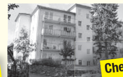
Chemnitzer Straße 1b

26 WE mit 2 Räumen, Bad, Küche/Kochnische, Balkon, Gemeinschaftsraum