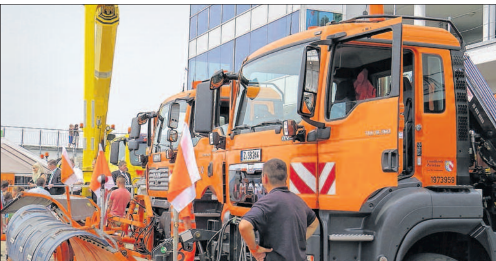
Impressionen vom 16. Sächsischen Verkehrssicherheitstag 2014