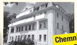
Chemnitzer Straße 3

34 1-Raum-Whg 30 qm, 3 WE mit 2 Räumen, Bad, Balkon, Küche/Kochnische, Gemeinschaftsraum