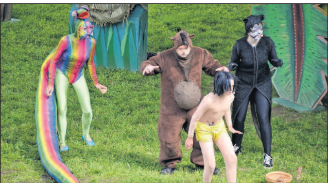
Impressionen der Theateraufführung