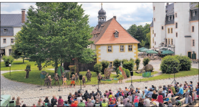
Blick auf das Spektakel im Schlosshof Blankenhain

Gastspiel des Ensemble der Naturbühne Trebgast