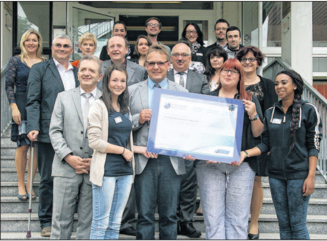
Stolz wurde der Status IB-World-School präsentiert.