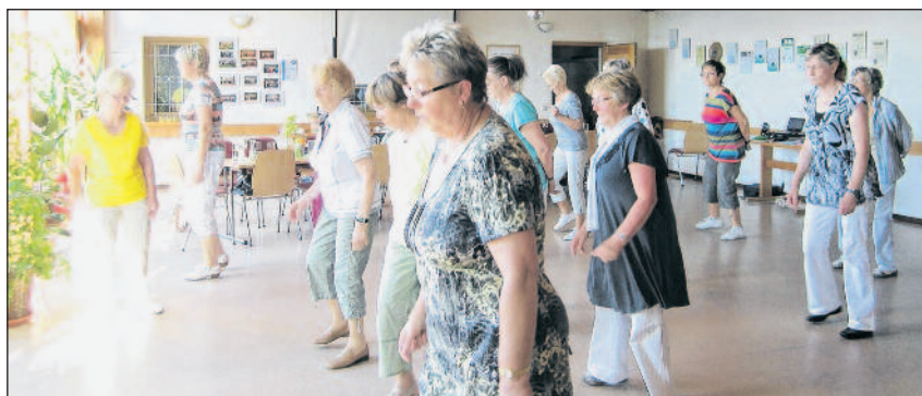
Tanzkurs bei der Volkshochschule