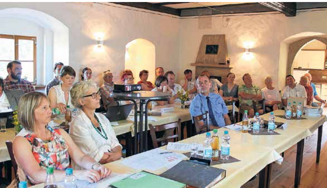
Mitglieder des Entscheidungsgremiums bei der Auswahl eingereicherter Vorhaben in öffentlicher Sitzung, im Hintergrund zahlreiche Gäste

Kühlen Kopf mussten die Mitglieder des Entscheidungsgremiums am 23. Juni 2016 bewahren. Ursache war der bis dahin heißeste Tag des Jahres und die Auswahl der besten Vorhaben, für die im zweiten Projektauftrag der LEADER-Region Zwickauer Land Fördermittel beantragt wurden.