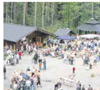
Am 4. September 2016 findet der 15. Werdauer Waldtag statt.

15. Werdauer Waldtag und 4. Sächsischer Waldbesitzertag