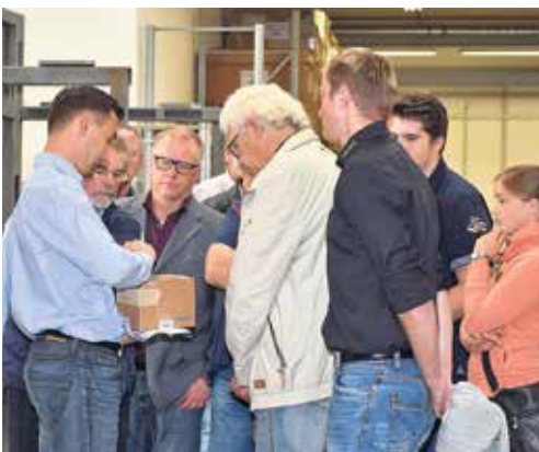
Führung bei der USK Karl Utz Sondermaschinen GmbH Limbach-Oberfrohna

Spätschicht-Führungen wurden sehr gut angenommen