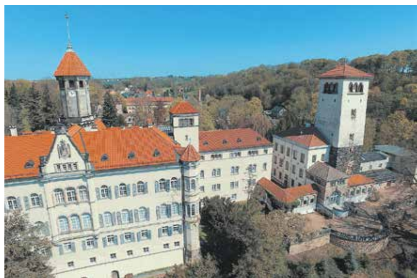
Schloss Waldenburg

Beruflichen Schulzentrum „August Horch“ Zwickau, am Beruflichen Schulzentrum für Bau- und Oberflächentechnik, Außenstelle Limbach-Oberfrohna an der Ausbildungshalle Technik, am Beruflichen Schulzentrum für Wirtschaft, Gesundheit und Technik Werdau an der Sporthalle und am Gymnasium „Am Sandberg“ in Wilkau-Haßlau. Von den Investitionen, die im Maßnahmenplan, unterstützt durch Landesmittel, festgeschrieben sind, befinden sich gegenwärtig ebenfalls in der Realisierungsphase die Verbesserung des Brandschutzes an der Schule zur Lernförderung „Am Sachsenring“ Hohenstein-Ernstthal. So gut wie abgeschlossen sind die Trockenlegung an der Dr.-Päßler-Schule, Schule für geistig Behinderte in Meerane, und der Stützmauerbau an der Sonnenbergschule, Schule für geistig Behinderte Werdau. Gleichfalls fleißig gebaut wird im Dienstgebäude des Landratsamtes in Glauchau, Gerhart-Hauptmann-Weg 1. Dieses Objekt wird komplett saniert und behindertengerecht ausgebaut. Die Bauarbeiten werden sich bis Ende 2018 hinziehen. Für 2018 ist der Beginn des Neubaus der Schulsporthalle am Gymnasium „Am Sandberg“ Wilkau-Haßlau vorgesehen. Der Fördermittelbescheid wurde am 22. September 2017 dem Landrat Dr. Christoph Scheurer