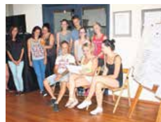
Die beiden bekannten Titel der Bücher von Hessel „Empört Euch“ und „Engagiert Euch“ bieten viel Stoff für gesellschaftspolitische Gespräche, wie auch bei den Schülern des Beruflichen Schulzentrums Lichtenstein. Foto: Anne-Sophie Berner

Wanderausstellung der Maria-Pawlowna-Gesellschaft e. V. Weimar – Fotos von Britta Rost (Apolda)