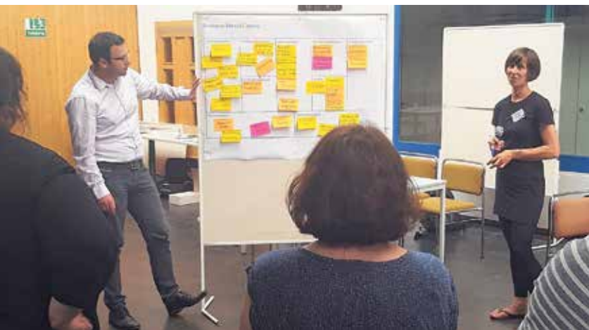
Vorstellung der Projektideen durch die Teilnehmenden

Am 15. August 2017 fand die erste Ideenfabrik im Rahmen des EU-Projektes InduCult2.0 in Zwickau statt.